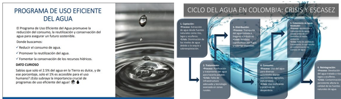
Imagen 1 Recorte de presentación sensibilización Uso eficiente del agua

Estas acciones han buscado sensibilizar a los colaboradores sobre la importancia del uso responsable del recurso hídrico y paralelamente, implementar diversas medidas orientadas a reducir el consumo de agua en la Entidad, promoviendo prácticas sostenibles y alineadas con la protección del medio ambiente.